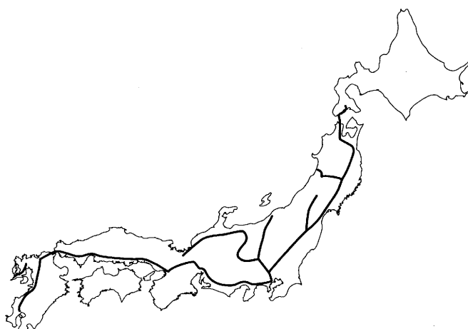
図 全国の新幹線ルート